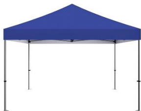
Table d'appel : Pour les épreuves de piste, tous les athlètes devront obligatoirement se présenter 40 minutes avant l'épreuve à la table d'appel. Pour les concours, il n'y aura pas de table d'appel, et les athlètes iront directement à leur épreuve au plus tard 30 minutes avant le début de l'épreuve, à l'exception du saut à la perche (60 minutes avant le début de l'épreuve). Tout athlète qui ne respecte pas cette consigne sera exclu de l'épreuve.

Les listes de départ seront établies en fonction des meilleures performances enregistrées dans les statistiques d'athlétisme Canada en salle et en plein air depuis la saison en plein air 2022. Dans le cas d'absence de performance, l'athlète sera placé dans la vague la plus faible. La fédération se réserve le droit de rectifier les temps d'inscriptions.